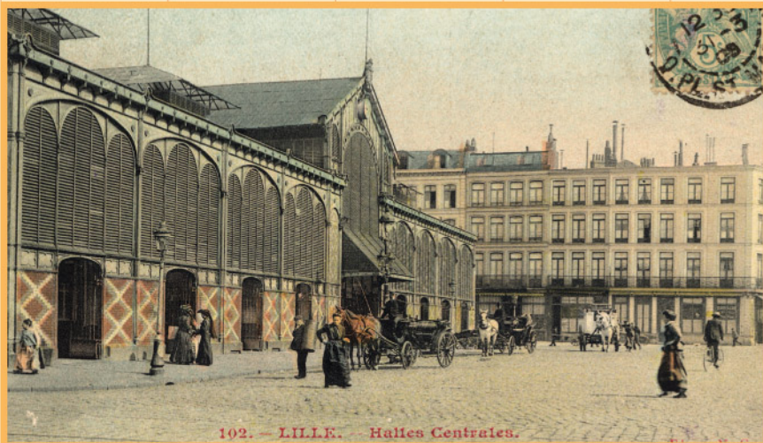
102. - LILLE. - Halles Centrales.