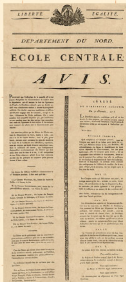
Affiche de l'École centrale du département du Nord