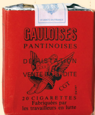
Paquet de cigarettes « Gauloises-Pantinoises »