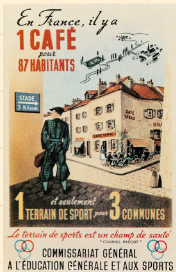
Affiche de propagande pour les sports