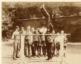
Gymnastique dans la cour de l'institution Pilate à Lille