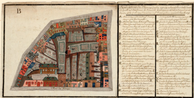
Plan d'une fabrique d'amidon et de maisons à Cambrai en 1782