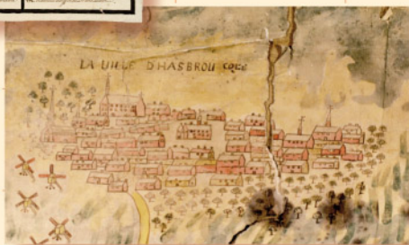
Vue cavalière de Hazebrouck au XVII e siècle