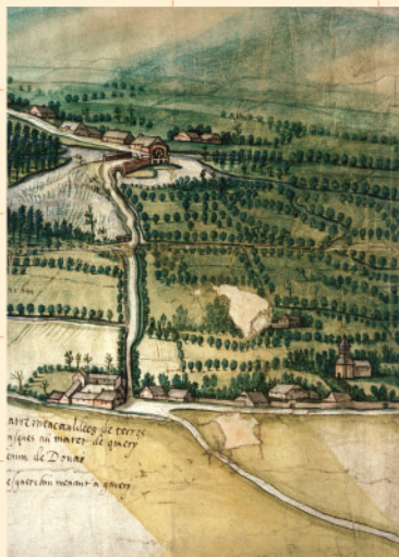
Le marais et le moulin à eau d'Esquerchin au XVII e siècle